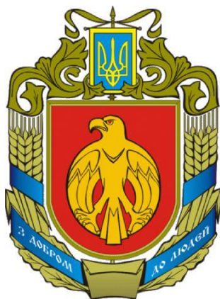
Герб Кіровоградської області