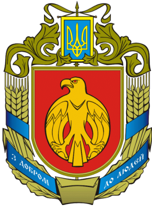
Герб Кіровоградської області