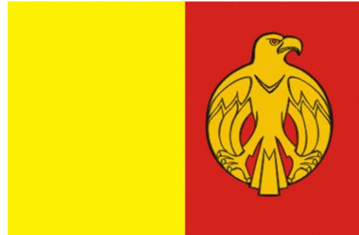
Прапор Кіровоградської області