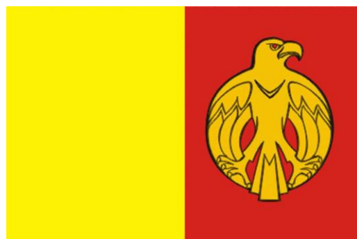
Прапор Кіровоградської області