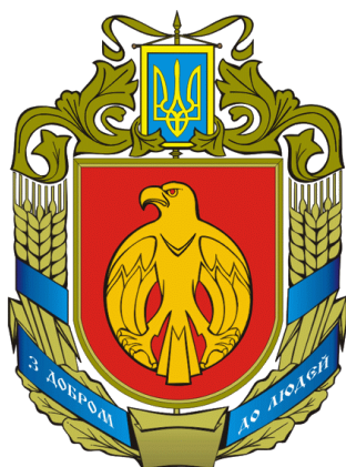
Герб Кіровоградської області